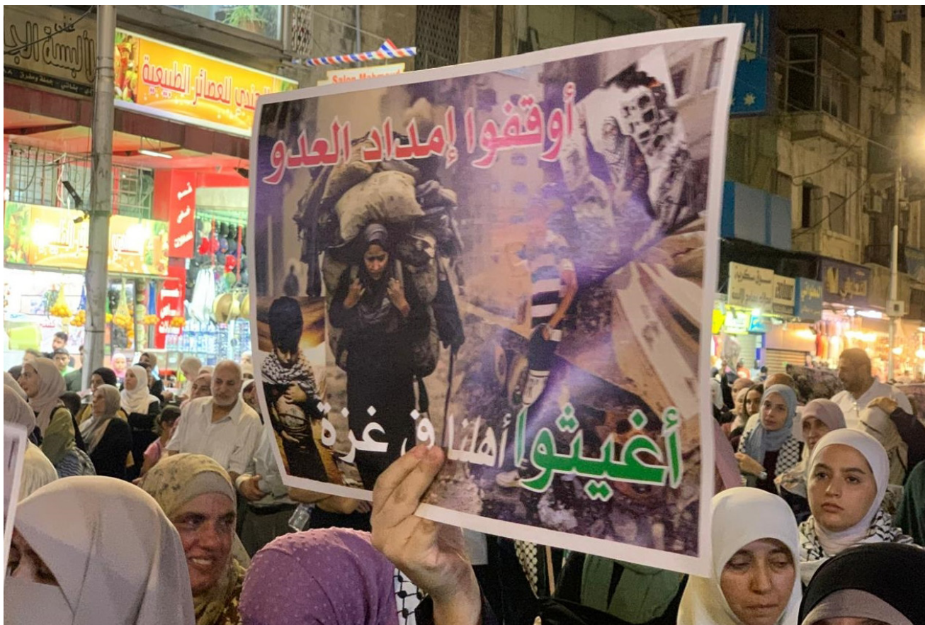
Des manifestants pro-palestiniens protestent contre les attaques israéliennes sur la bande de Gaza sur la place Al-Nahil. Amman, le 19 juillet 2024.

de stopper des manifestants qui étaient en route vers Karameh, en vue d'un rassemblement au monument du soldat inconnu de la bataille israélo-jordano-palestinienne éponyme de 1968, en soutien à la résistance à Gaza (S. Shay & J. Rosen-Koenigsbuch, « Jordan and the War in Gaza », ICT Special Report , Reichman University, 19 octobre 2023).