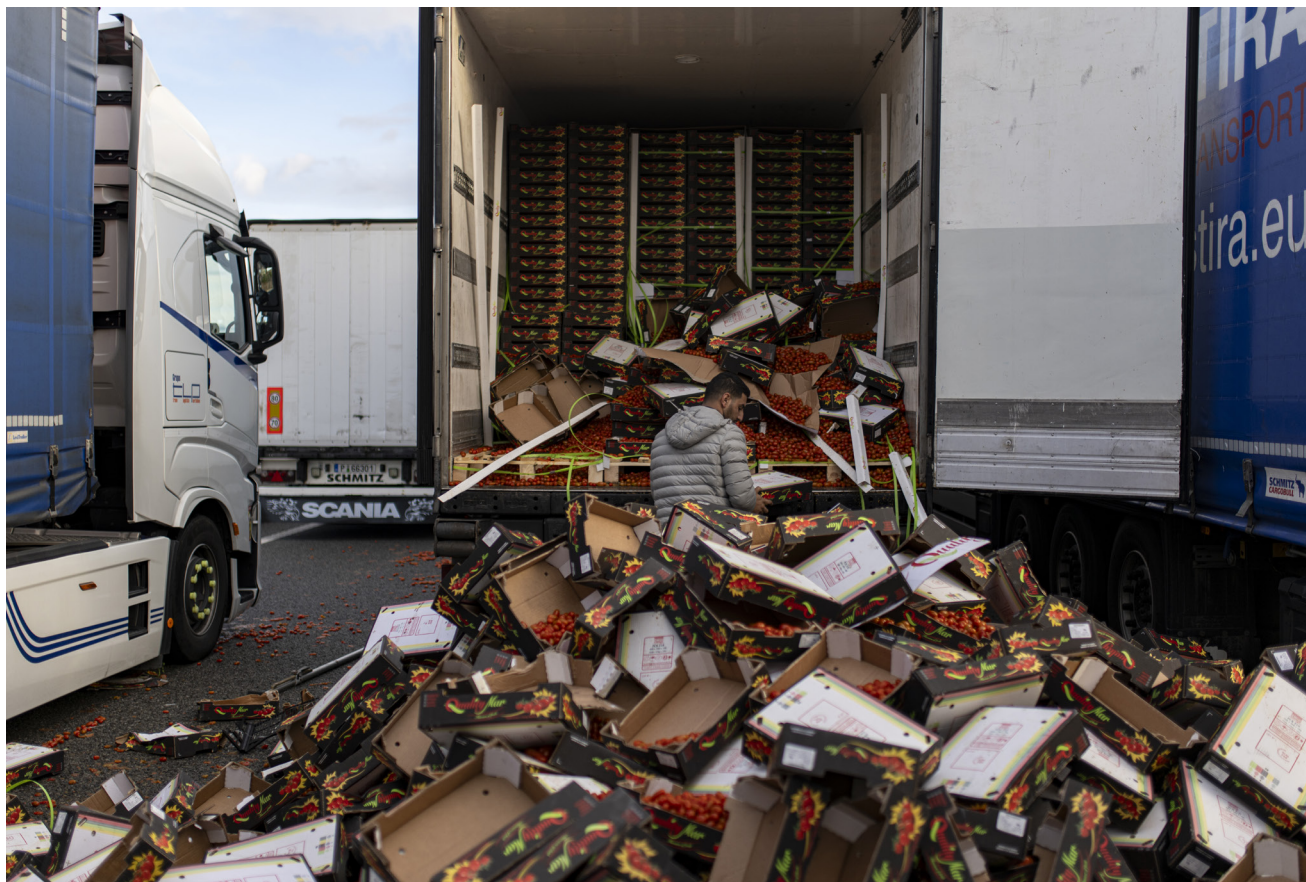
Manifestation des agriculteurs espagnols contre les politiques agricoles européennes, ainsi que contre les produits provenant du Maroc. Gérone, février 2024.

raient être nécessaires pour moderniser l'agriculture maghrébine selon les directives européennes. Cela inclurait des infrastructures, des technologies et des programmes de formation. Dans ce contexte, le cadre réglementaire de ces pays est relativement favorable aux investissements étrangers.