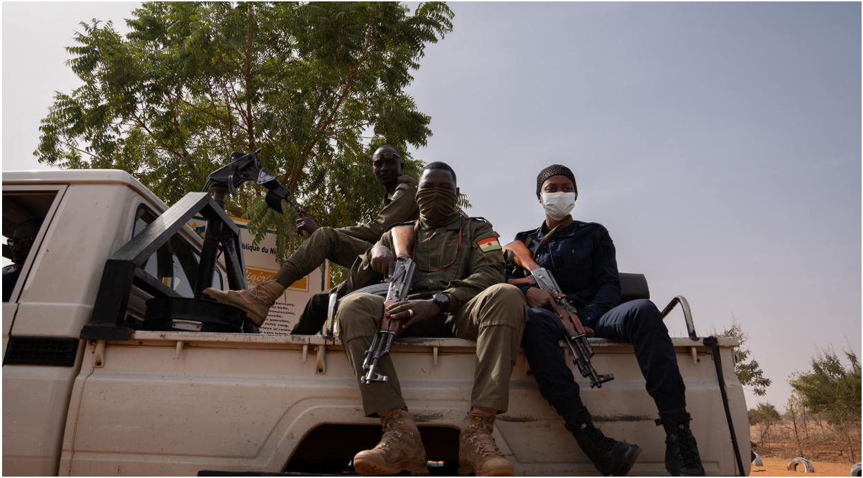
Des Nigériens armés à Ganguel, Sokoto, Niger.

nie. La guerre s'est terminée sans vainqueurs ni vaincus, car tant les rebelles revendiquant le sécessionnisme que ceux proclamant un État islamique ont maintenu leurs positions, leurs hommes et ont continué à gagner du terrain. Face à cette situation, l'État malien a commencé à remettre en cause l'intervention française et a décidé de récupérer la souveraineté sur la sécurité du pays et d'élargir le champ de ses relations internationales en collaborant avec d'autres États, comme la Russie. Suite à ce mouvement du Mali, la France a déplacé toute sa stratégie vers le Niger, qui est devenu le noyau dur de ses opérations. La crise entre la France et le Mali a affaibli les autres opérateurs de sécurité européens qui ont accompagné le leadership français, mais l'objectif de la France est de poursuivre son intervention.