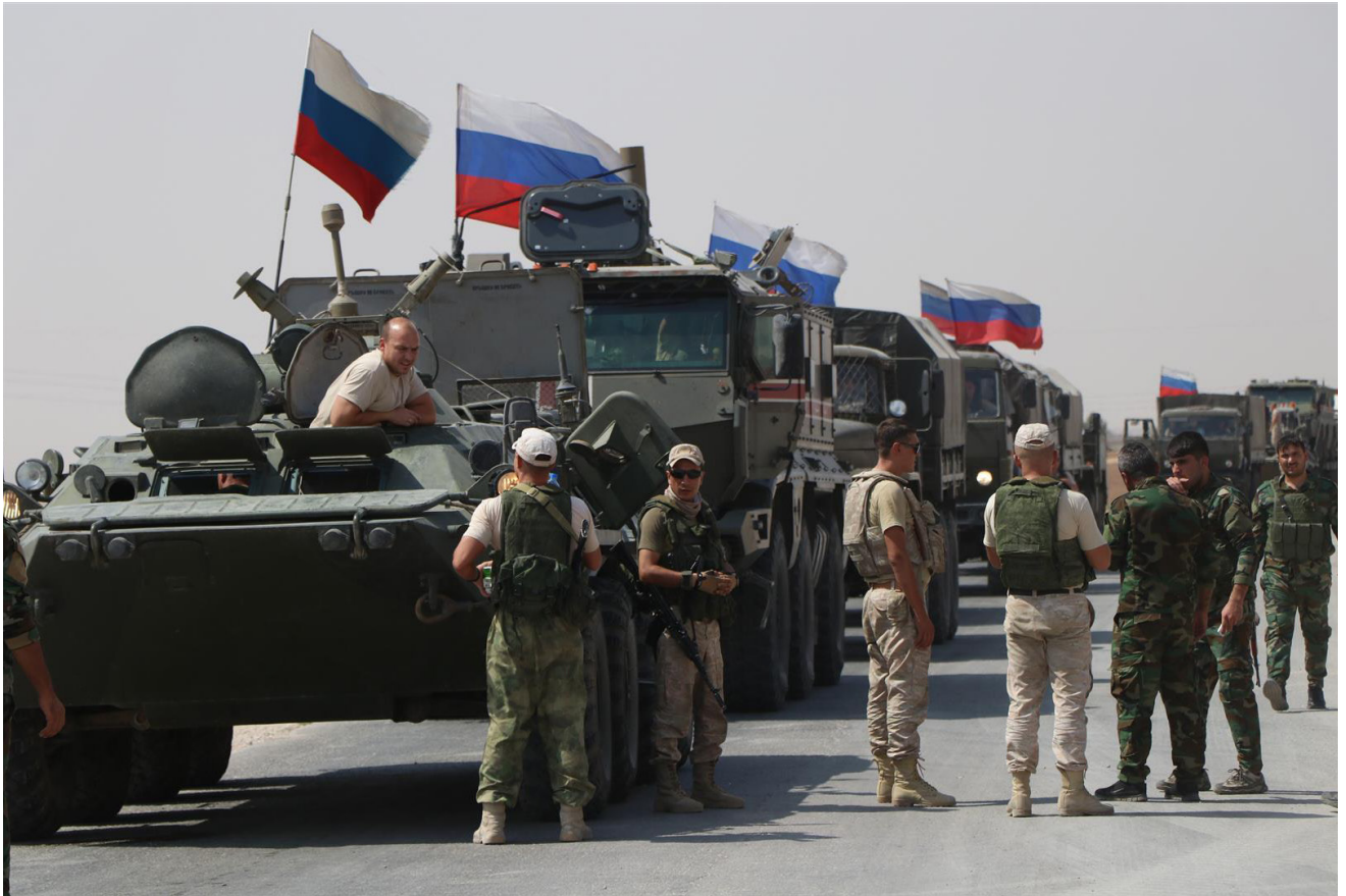
Vehículos militares rusos en Qamishli, Siria. Septiembre de 2020.

blindados BMP-3. En 2013 Libia importó de Rusia 360 misiles antitanque. Catar adquirió 500 misiles SAM para ser incorporados en blindados. La única compra de material ruso por parte de Arabia Saudí es la de 10 lanzacohetes TOS-1. Antes del comienzo de la guerra de Yemen, Emiratos Árabes Unidos importó 1.200 misiles SAM y 5.000 misiles antitanque una vez iniciada la guerra. Egipto ha importado de Rusia 290 misiles SAM con sus respectivos sistemas, 24 helicópteros de transporte militar y 62 de combate, dos satélites de uso civil y militar, 2.000 misiles antitanque, 130 blindados y 50 aviones de combate MIG29. Argelia es quien mayor cantidad y diversidad de armamento ha adquirido de la Federación Rusa en este periodo: 1.300 misiles SAM, nueve radares de uso aéreo y marino, 7.500 misiles antitanque, 130 misiles y torpedos antibarco, 46 cazas Su-30MK y 14 MIG29, 563 tanques y blindados y dos submarinos.