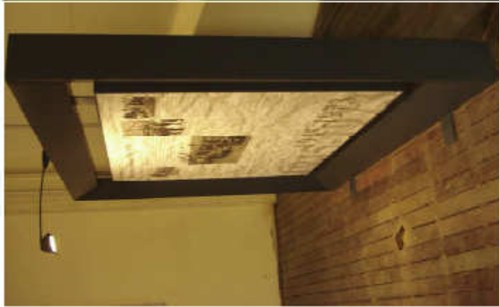
Bañador de model 74/18/04 Base Negra, TROLL