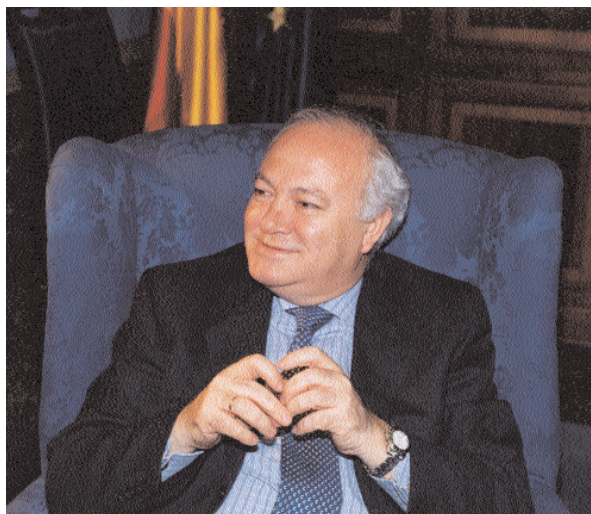
Miguel Angel Moratinos : « L'Espagne a soutenu la résolution des Nations unies pour l'Iraq car il était indispensable de recouvrer un consensus international » / M. A. ETRANGÈRES

lienne et irlandaise ne se sont pas écartées des objectifs qui y étaient définis. A l'heure actuelle, la relance du Processus se déroule suivant plusieurs voies complémentaires : le lancement de la nouvelle politique de voisinage de l'UE (« Barcelone-plus ») ; l'amélioration des méthodes de travail et le développement de l'architecture institutionnelle du partenariat contenue dans le PAV (avec l'intégration au Processus de Barcelone de la Assemblée parlementaire euro-méditerranéenne en qualité d'organe de consultation, la mise en marche de la fondation euro-méditerranéenne Anna Lindh pour le dialogue des cultures et des civilisations, et le