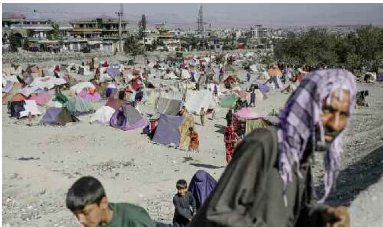
Campamento de desplazados internos en Kabul. Septiembre de 2021.

zadas de la gestión de la migración, se reflejaron más adelante en el acuerdo entre la UE y Turquía, que permitió a cada vez más inmigrantes cruzar el Egeo. A medida que nuevas olas de migrantes irregulares alcanzaban las costas europeas –y proseguían el viaje hacia el Norte–, el enfrentamiento entre los Estados sobre sus responsabilidades no hizo más que agravarse. A partir de 2018, la imagen de miles de afganos en pequeñas lanchas, saliendo de las playas francesas para atravesar el Canal, puso aún más de manifiesto la ruptura de la colaboración entre los gobiernos francés y británico, así como los límites de la condicionalidad.