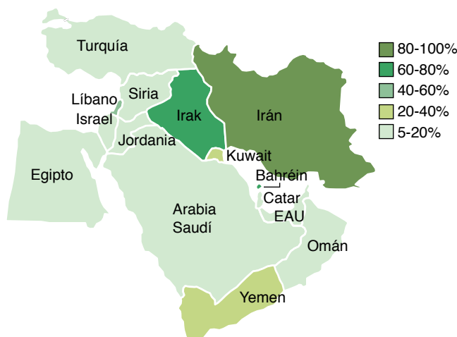
Distribución de chiíes