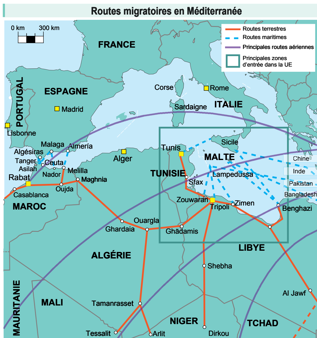
Source : "Med.2006. L'année 2005 dans l'espace euroméditerranéen." IEMed; Cidob. 2006.

Face à ce panorama prospectif, on peut constater pour l'instant que l'Europe renonce à considérer d'autres approches et persiste dans le maintien d'une perspective de contrôle et de surveillance frontalière qui gagne même du terrain, surtout à partir du moment où le contrôle aux frontières est considéré comme un élément clé pour la sécurité interne de l'UE et qu'il est conçu comme une réponse à l'instabilité économique, sociale et politique des pays voisins.