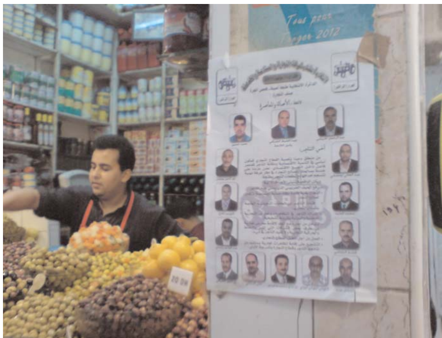
Campagne électorale du PAM lors des élections aux Chambres du Commerce et de l'Industrie dans les souks, étal de vente de pain et de cigarettes au détail. Tanger, 24 juillet 2009.

sants candidats liés à la tribu dominante, Rguibat, bien que sous l'étiquette de partis nationaux comme l'Istiqlal ou le Mouvement populaire (MP) ont balayé le PAM qui prétendait rompre leur monopole. Les registres tribaux ont fonctionné d'une telle façon que bien que ce parti présentait un secrétaire général sahraoui, la population a réagi massivement face à ce qu'elle percevait comme une ingérence extérieure. Naturellement l'argent y a eu puissamment contribué. Si l'on tient compte de cela, tenter de présenter devant l'opinion publique la forte participation au Sahara comme un facteur à l'appui des thèses marocaines pour le Sahara est une erreur qui ne trompe personne.