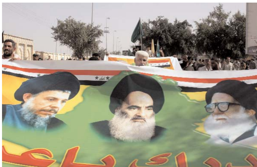
Une pancarte avec les images (de gauche à droite) de l'ayatollah décédé Mohammed Baker Al-Sader, du grand ayatollah Ali Al-Sistani et de l'ayatollah décédé Mohammed Sadeq Al-Sader précède la manifestation de soutien au premier ministre contesté Ibrahim Al-Djaafari dans la ville sainte de Nadjaf, le 4 mars 2006. Des factions politiques kurdes et sunnites ont rejeté la candidature de Djaafari, pour diriger le prochain gouvernement.

Dans ce contexte, la disparition de la vie politique active du premier ministre israélien Ariel Sharon et le considérable – et inattendu – triomphe électoral de l'organisation Hamas, que les USA et Israël ont qualifié de terroriste, auxquels s'ajoutent les carences, voire la corruption, de l'Autorité nationale palestinienne, ont ouvert une nouvelle étape d'incertitude pour Israël et le Proche-Orient. Les palestiniens affirment que peu leur