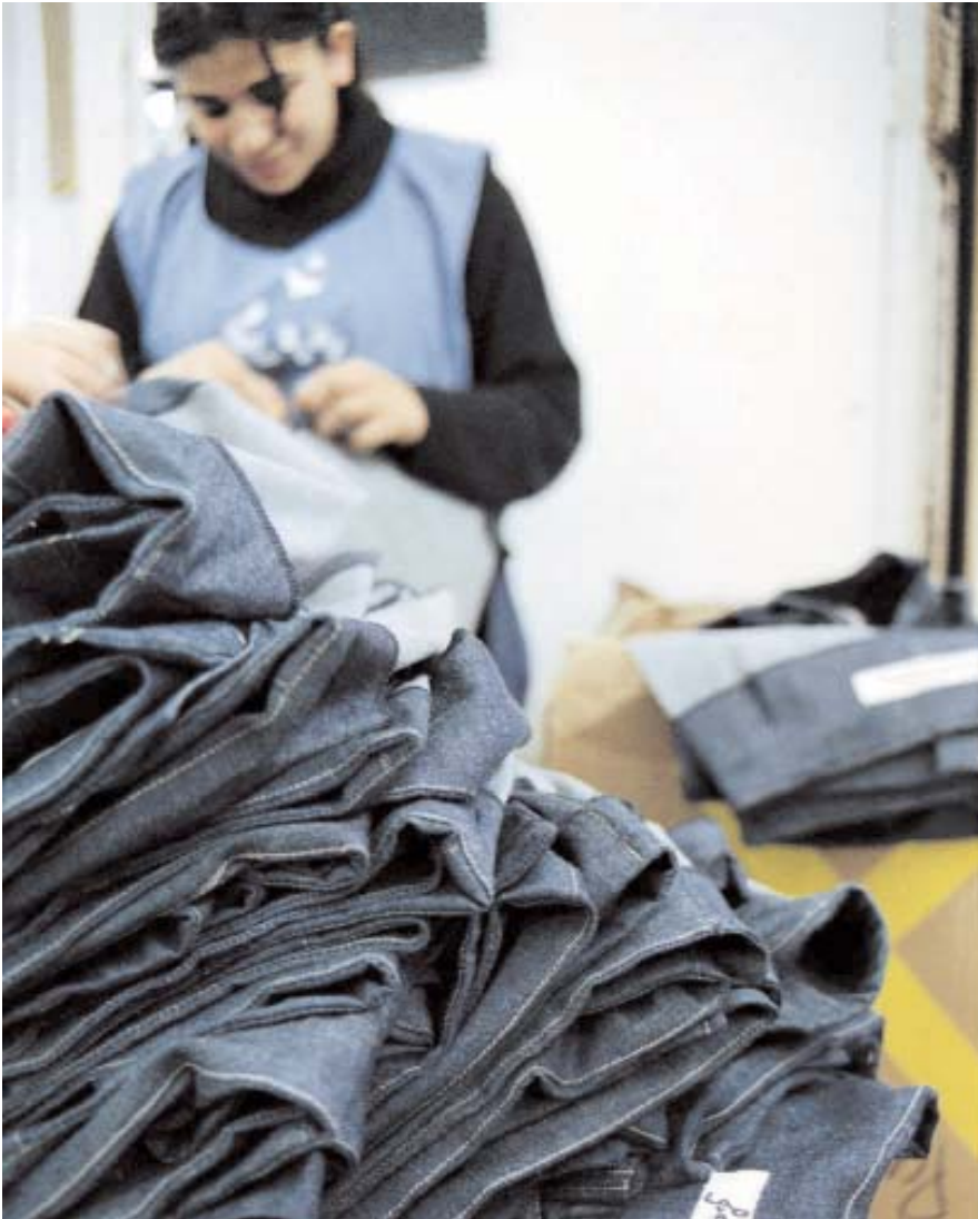
Usine textile à Asilah. Maroc.

mètres de long, coûte 6 500 euros sur un trajet aller et retour, au lieu de 5 600 en Tunisie), les charges sociales (révision du salaire minimum, qui s'élève à 164,09 euros) et le coût de l'énergie (0,092 dollars le kilowattheure, au lieu de 0,047 en Tunisie). De plus, la cotisation à la Sécurité Sociale est élevée et la pression fiscale s'élève à 42,65 euros, au lieu de 34,11 en Tunisie ou 18,8 en Egypte.