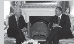
Maragall va anunciar la conferència el passat mes d'abril a Istanbul, on es va reunir amb el primer ministre, Recep Tayyip Erdogan.

Coincidint amb la celebració del desè aniversari de la Conferència Euro-mediterrània, Barcelona acollirà una Conferència Euro-med de Regions Barcelona+10. Així ho va avançar el president de la Generalitat de Catalunya, Pasqual Maragall, durant la seva visita oficial a Turquia a mitjans d'abril. Un dels principals objectius de la trobada serà intensificar el diàleg i la cooperació entre els governs locals i regionals en el marc del Procés de Barcelona, amb la finalitat de promoure una política de desenvolupament regional i explorar la creació d'un instrument específic per coordinar millor les autoritats subestatales descentralitzades en els 35 estats integrants del Partenariat Euro-mediterrani. Es preveu que la conferència aprovi una declaració amb recomanacions per a una millor coordinació de les regions, que es lliurarà a les autoritats de la Cimera del Desè Aniversari Euromed.