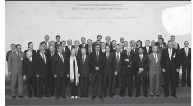
Luxemburg va acollir al maig la VII Conferència Euro-mediterrània, l'última abans de la trobada a Barcelona, amb la novetat que ja va incloure els nous estats membres de la UE després de l'ampliació. Des d'aleshores el Partenariat Euro-mediterrani compta amb 35 membres.

bon govern, els drets humans i la democràcia, i ha aconseguit que la majoria dels països socis mediterranis i la UE subscriguin acords d'associació. Aquests progressos, sumats a alguns avenços en acords comercials de lliure comerç entre països del sud i l'aparició d'institucions com l'Assemblea Parlamentària Euro-mediterrània, el Fons Euro-mediterrani d'Inversió i Associació i el recentment inaugurada Fundació Anna Lindh per al Diàleg entre Cultures, consoliden un espai on poder desenvolupar tot el potencial del Partenariat Euro-mediterrani.