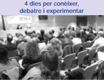
Sessió regional del congrés MHI a Barcelona.