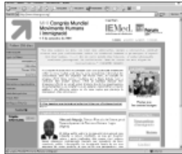
La pàgina web de l'MHI permet seguir el dia a dia de l'organització d'aquest esdeveniment, així com l'actualitat sobre el fenomen de la immigració.

En aquest marc s'inscriu el seminari "Immigració en l'Agenda Euromediterrània. Noves claus: partenariat, seguretat i desenvolupament", organitzat a Barcelona a mitjan novembre per l'IE Med i la EuroMediterranean Study Commission (EuroMeSCo). Entre les conclusions