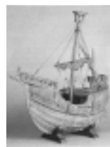
Coca de Mataró, segle XV (Maritime Museum, Rotterdam).

El comerç marítim, eina cabdal en aquest procés d'integració de les diferents economies mediterrànies, i l'increment dels contactes culturals constitueixen l'eix de l'exposició del Museu Marítim. Els apartats en què es divideix la mostra van des de la construcció dels vaixells fins al paper del port en la configuració de la ciutat medieval mediterrània, passant per la vida a bord, les pràctiques i tècniques associades a la navegació, així com la mentalitat i la religiositat dels mariners o l'organització dels viatges comercials.