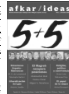
Portada del primer número d' afkar/ideas .

periodistes, actors culturals i altres representants de la societat civil tunisenca. Amb aquesta iniciativa, l'IE Med vol fer un pas més en la creació de ponts per millorar el coneixement mutu entre les societats de la Mediterrània.