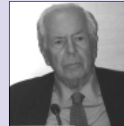
Jean Daniel, director de Le Nouvel Observateur .

Jean Daniel, director i fundador de la revista Le Nouvel Observateur , va pronunciar el passat 17 de setembre, a l'IE Med, la conferència "Universalisme dels valors i diversitat cultural". En el marc del cicle de conferències "Tribuna Mediterrània", el veterà periodista, nascut a Algèria el 1920, va exposar la defensa que diferents cultures i països poderosos han fet, al llarg de la història, de determinats "valors universals". Per altra banda, davant la creixent diversitat cultural va proposar el laïcisme com a mitjà per garantir la llibertat individual.