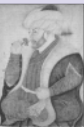
Retrat del soldà Mehmed II el Conquistador (segle XV). Topkapı Sarayı, Istanbul.